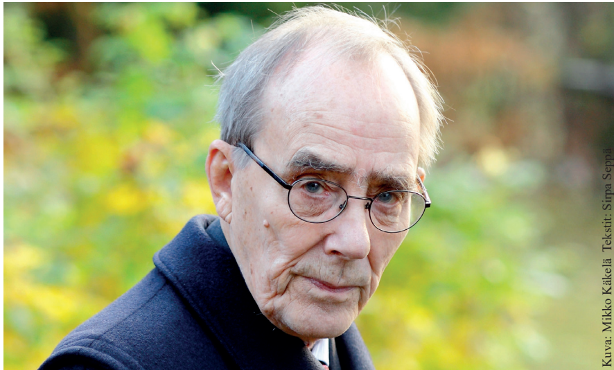
Tekstit: Sirpa Seppä

”Turvautuminen leipäjonoon on nöyryyttävä kokemus kenelle tahansa. Ei sinne kukaan mene tuttaviaan tapaamaan. Puute ja nälkä ajavat. Tilastot kertovat, että moni vanha ihminen elää köyhyydessä. Kun köyhyys ja yksinäisyys kulkevat rinnakkain, kaukana ovat elämän merkitys ja toivo. Siitä on kysymys tämän vuoden Yhteisvastuukeräyksessäkin.”