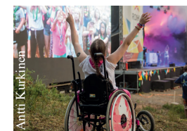
Sisupartioiminta on iloista yhdessäoloa ja -oppimista.